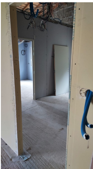
Espace bureau du maire