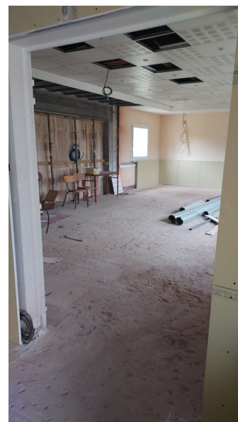
Salle du conseil municipal