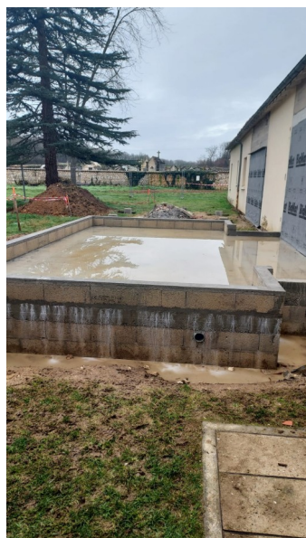
Extension du secrétariat

Dans la salle du conseil municipal et des mariages, une grande ouverture a également été réalisée, apportant davantage de luminosité et une meilleure circulation des espaces. Un important travail de rafraîchissement y sera prochainement engagé afin d'améliorer le confort et l'esthétique de cette salle emblématique de la vie communale.