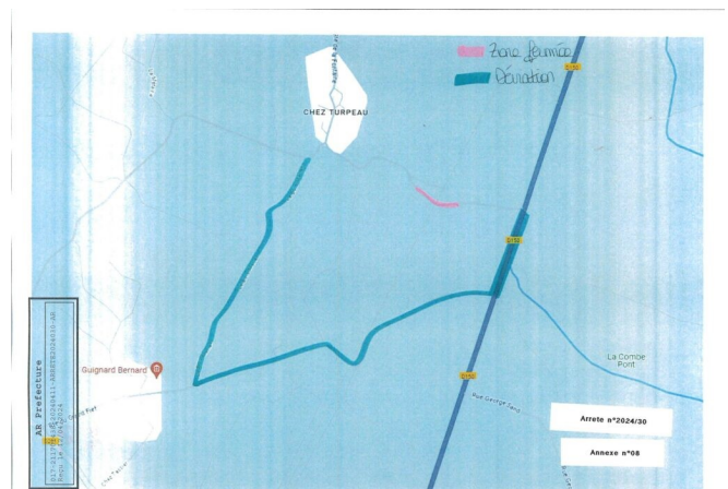
Déviation suite aux travaux à « Le Grand Fief »

Pour des raisons de travaux sur le pont SNCF au lieu-dit « Le Petit Puy Gibaud », la circulation sera interdite du mercredi 24 avril 2024 au 05 mai 2024