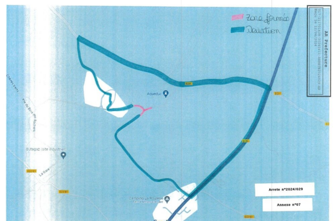
Déviation suite aux travaux Chemin de Chez Pesson