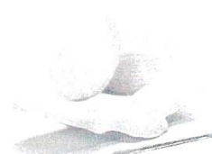
Déchets de salle de bain (cotons, lingettes, serviettes hygiéniques, rasoirs jetables, mouchoirs, cotons-tiges...)