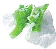
Essuie-tout, serviettes en papier