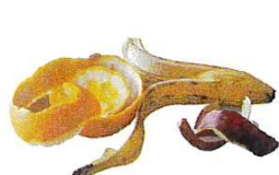
Déchets de repas

JE DÉPOSE DANS LE SAC/BAC D'ORDURES MÉNAGÈRES