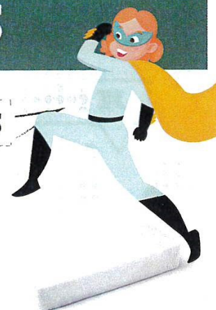
Polystyrène de calage